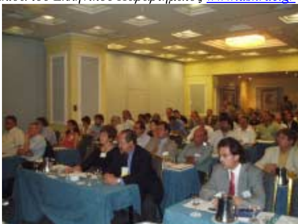
Το ακροατήριο της εκδήλωσης. Στις δυο πρώτες θέσεις διακρίνονται ο Πρόεδρος της ASHRAE Ron Vallort και η σύζυγός του Carolyn.

Οι παρουσιάσεις των ομιλητών είναι διαθέσιμες στην ιστοσελίδα του Ελληνικού Παραρτήματος www.ashrae.gr