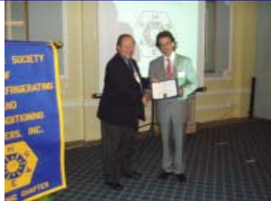
Στον απερχόμενο Πρόεδρο του Ελληνικού Παραρτήματος Κώστα Λύτρα , απενεμήθη αναμνηστική πλακέτα από τον Πρόεδρο της ASHRAE Ron Vallort (δεξιά).