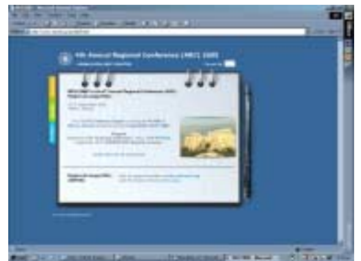
Υπεύθυνος της ιστοσελίδας για το ARC 2005 είναι ο Σίμος Κοντογιαννίδης