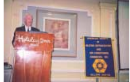
Ο Πρόεδρος της ASHRAE, Donald COLLIVER, Ph.D., P.E.

Πληροφορίες για προσεχείς εκδηλώσεις του Σωματείου «Ελληνικό Παράρτημα της ASHRAE» παρουσιάζονται στην ιστοσελίδα www.ashrae.gr